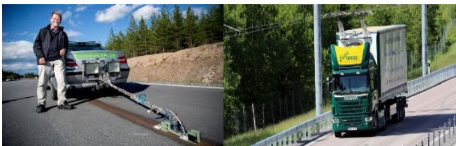
Teknikleverantörer & fordonstillverkare

2. Öka utbud och konkurrens av elvägstekniker