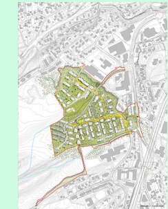
Områdeplan med reguleringsbestemmelser